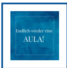
Endlich wieder eine AULA!