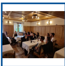
Dienstanfänger- veranstaltung des BLLV