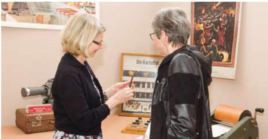
Eine Zeit noch ohne digitale Medien und Whiteboards.

Als Ausstellung in der Ausstellung präsentiert wird „Bloß nicht erwischen lassen! Spickzettel – die verborgene Seite der Schule“ aus dem Schulmuseum Nürnberg. Über 1000 originalen Spickzettel aus aller Welt bieten einen amüsanten Blick hinter die Kulissen und geben Einblick in die schöpferischen Fähigkeiten prüfungsgeplagter Schülerinnen und Schüler. Neben den Klassikern aus Papier können umgebaute Armbanduhren, präparierte Schokolade, Hightech-Brillen und andere kuriose Basteleien bestaunt werden. Der berühmteste Spicker stammt von der Fußball WM 2006: Jens Lehmann, der Nationaltorwart, hatte sich darauf die Spielzüge der argentinischen Nationalmannschaft notiert. Ob es geholfen hat? Jedenfalls wurde das Elfmeterschießen gewonnen. Die Ausstellung soll natürlich nicht zum Spicken verführen, aber gibt einen umfassenden Überblick zum Thema Schummeln, Tricksen und Spicken in der Schule.