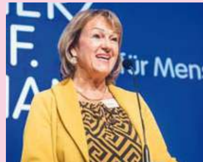
Auf der Landesdelegiertenversammlung wurde sie für die Gemeinschaft der Senioren im BLLV in den Landesvorstand gewählt.