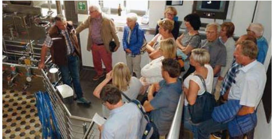
Die Besuchergruppe des BLLV-Kreisverbands Donauwörth im Hefekeller der Augsburger Privatbrauerei Riegele (Jana Römer)