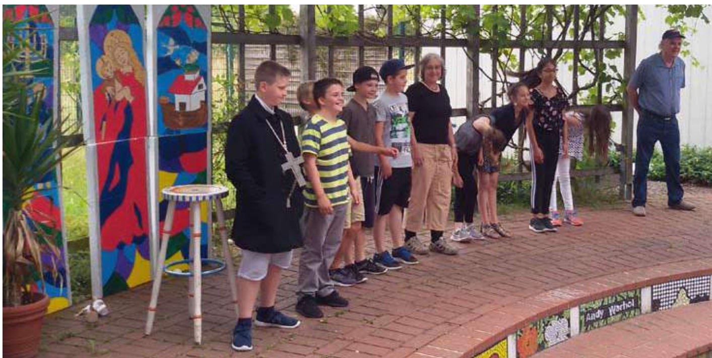
In einer Theater-AG gehen die jungen Schauspieler an ihre Grenzen – Mittelschule Neu-Ulm