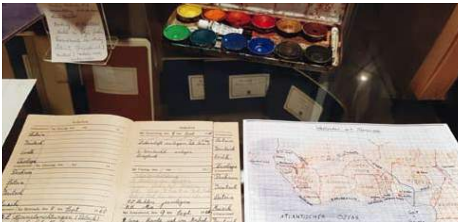
Hefteinträge noch ohne die Verwendung von Kopien – Schule im anderen Jahrtausend.