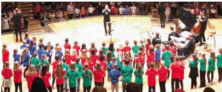
Gesang verbindet über Grenzen hinweg