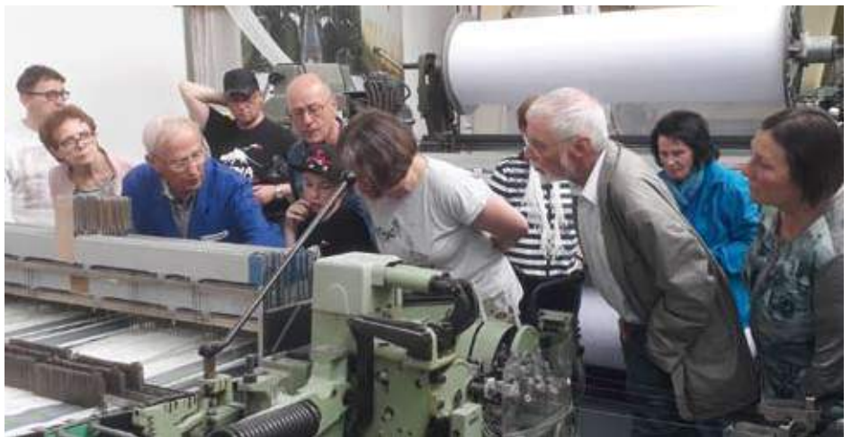
Im Textilmuseum laufen die Webstühle in Echtzeit