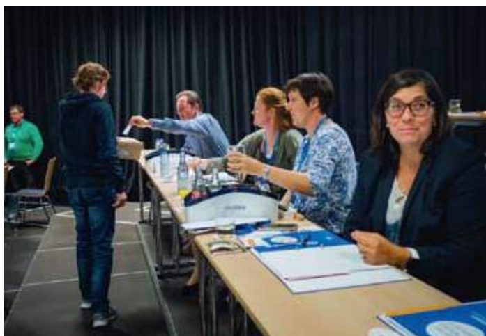
Die Wahlgänge fanden während der Antragsberatungen statt – das Wahlhelfer-Team aus Kempten war stets auf der Höhe der laufenden Ereignisse.