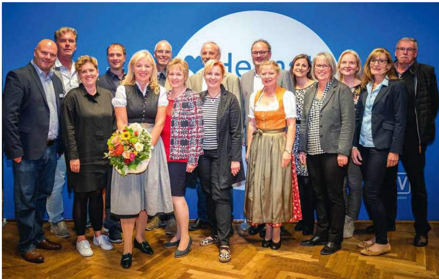
Mit dem Mandat bis 2022 ausgestattet geht die neue Mannschaft ans Werk. Sieben neue Vorstandsmitglieder bilden den Regierungsbezirk Schwaben vom Oberallgäu bis ins Donau-Ries ab.