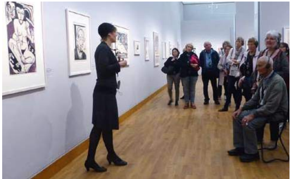
In zwei Gruppen erlebten die Teilnehmer der Kulturfahrt des BLLV Oberallgäu in Zusammenarbeit mit der Oberallgäuer Volkshochschule (OVH) eine interessante Führung durch die Ausstellung „Ernst Ludwig Kirchner – Die unbekannte Sammlung“ in der Staatsgalerie Stuttgart.