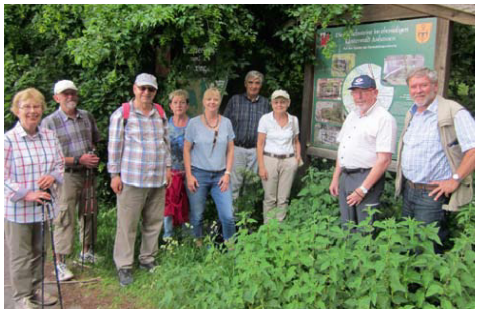
Im angrenzenden Waldgebiet – im Schlag „Stein“ fand die Gruppe den wichtigsten Grenzstein

Englischkenntnissen war es allerdings naheliegend, das sh als ein Sch zu lesen, also Schechs. Die Buchstaben abb. (lateinisch abbas = Abt) führten auf die richtige Spur: In einer Liste der in Auhausen einstmals tätigen Äbte stand