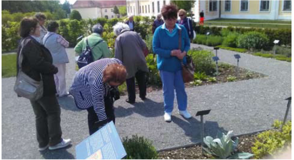
Die Ausflügler informieren sich über verschiedene Kräuterarten und ihre Anwendungs- und Wirkungsweise.